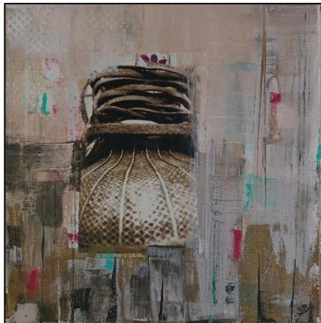
Ohne Titel Collage/Acryl – Jan 2020