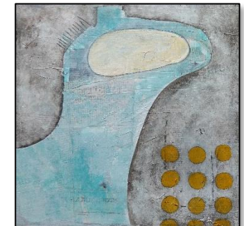
Ohne Titel Mixed Media – Okt 2022