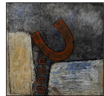
Ohne Titel Mixed Media – Okt 2022