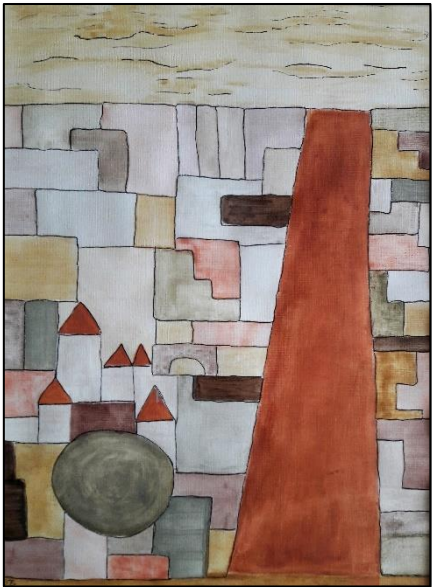
Wikkenhusen Aquarell/Naturfarben – Mai 2022