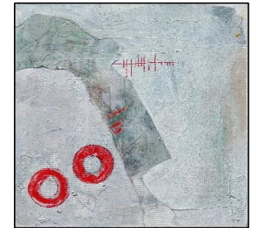
Ohne Titel Mixed Media – Okt 2022

Ist man zunächst recht frei unterwegs, so ergeben sich doch nach einiger Zeit Formen, die man aufgreift, ausgestaltet und am Ende in Szene setzt.