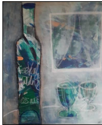
Absinth Acryl – Mai 2020