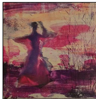
Tanz Collage/Acryl – Apr 2023

«Zwei Gemälde, die augenscheinlich nichts gemeinsam haben: das eine großformatig, das andere klein, die Stile völlig unterschiedlich und auch die Farben. Und doch verbindet beide ein Geheimnis.