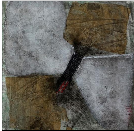
Ohne Titel Mixed Media – Okt 2022